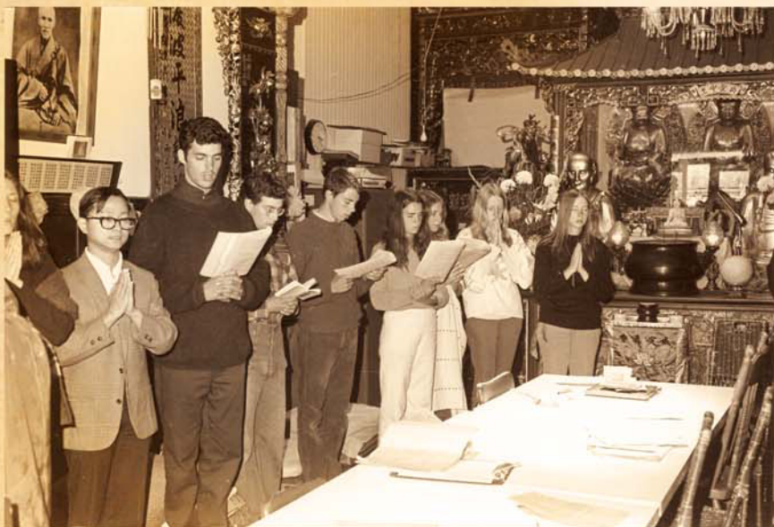
大家在一起聞熏聞修