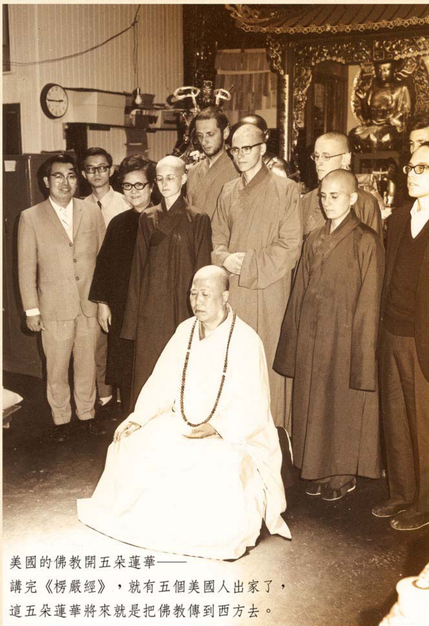
美國的佛教開五朵蓮華—— 講完《楞嚴經》，就有五個美國人出家了， 這五朵蓮華將來就是把佛教傳到西方去。