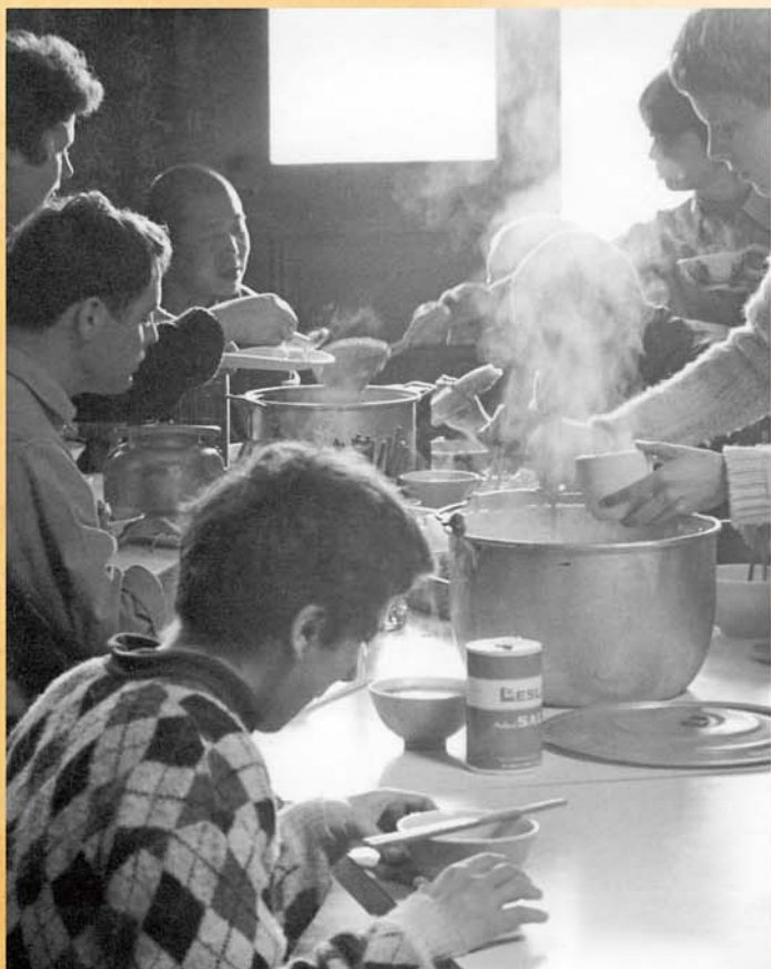
盡形壽供養學《楞嚴經》的人