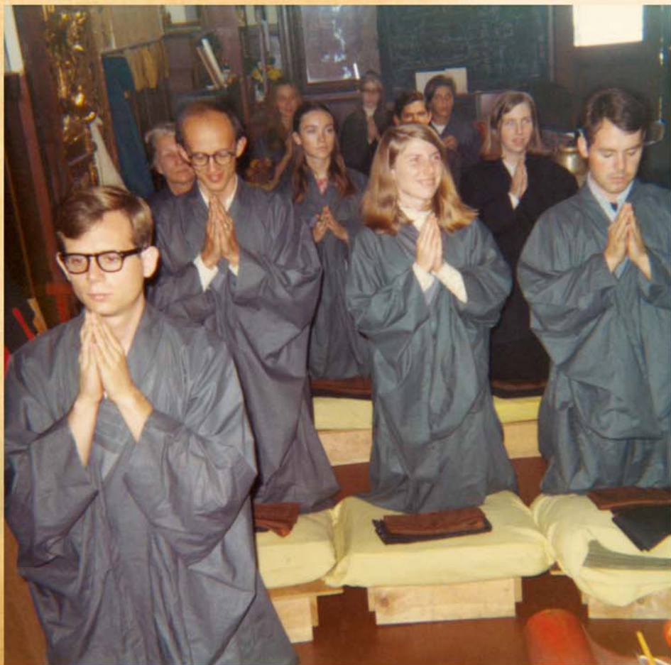
洗滌身心受菩薩戒